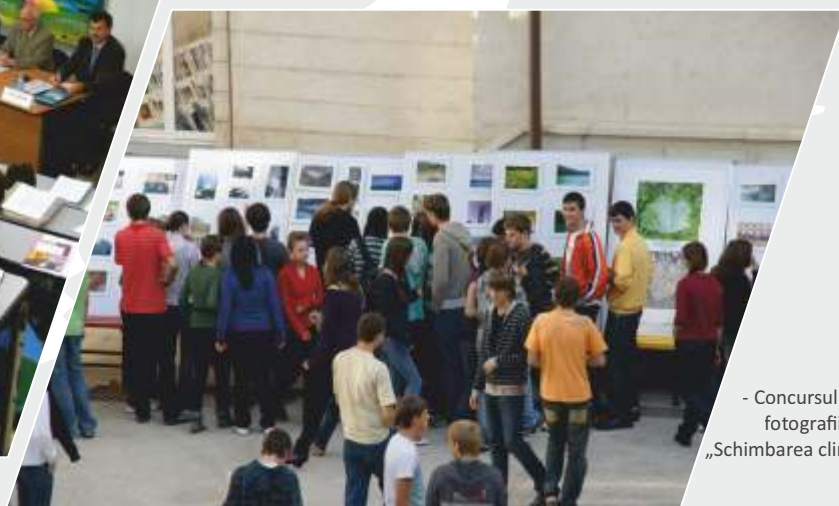
- Concursul de fotografii „Schimbarea climatică“

- Eveniment „ZIUA EUROPEI - 9 MAI“ - seminar indoor de instruire pentru aplicanții de finanțări nerambursabile cu tema „Anul European al Inovației și Creativității și Oportunități de Finanțare în Uniunea Europeană“;